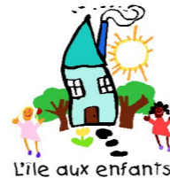
L'île aux enfants

Dépôt des articles le jeudi 1er décembre de 9h30 à 11h30 et de 16h30 à 19h30. Liste disponible à partir du 1er novembre et à retirer auprès de l'office du tourisme de Matha