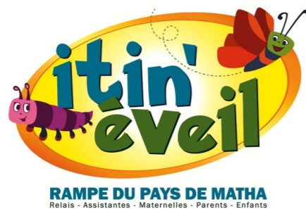
RAMPE DU PAYS DE MATHA Relais - Assistantes - Maternelles - Parents - Enfants

Christine Knaub interviendra également pendant les ateliers d'éveil du RAMPE les jeudis 6, 13 et 20 octobre à Mons, les vendredis 7, 14 et 21 octobre à Beauvais, les lundis 7, 14 et 21 novembre à Matha et les mardis 8, 15 et 22 novembre à Neuvicq afin d'initier les enfants à l'expression corporelle autour du thème de la nature.