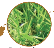
Tontes, fleurs et plantes fanées, herbes indésirables