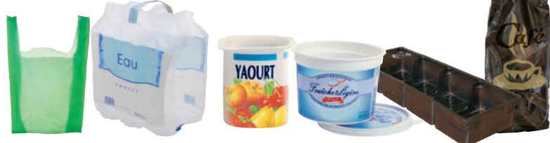
Emballages en plastique : films, sacs, suremballages, pots, étuis

Après le tri et le compostage il ne reste que quelques déchets à jeter dans le sac noir. Ils seront traités en unité d'incinération.