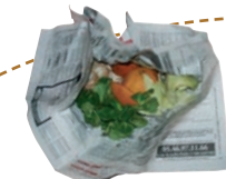
Fruits et légumes abîmés, épluchures