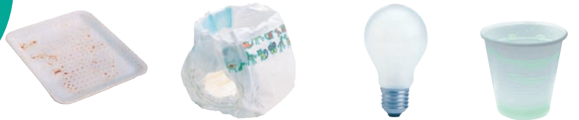
Barquettes en polystyrène Couches-culottes Ampoules Vaisselle jetable