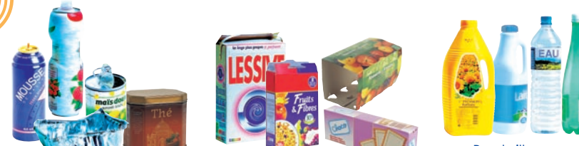
Bidons, aérosols, barquettes, boîtes en métal Cartonnettes, boîtes en carton Bouteilles en plastique d'eau, de lait, de jus de fruits et d'huile

Les emballages triés permettront la fabrication de nouveaux produits