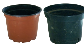
Pots de fleurs et godets en plastique