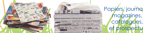
Papiers, journaux, magazines, catalogues, et prospectus