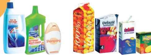
Flacons en plastique de produits ménagers et de toilette Briques de lait, de jus de fruits...