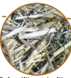
Brindilles, tailles, écorces