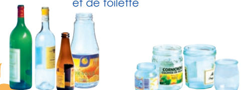
Bouteilles en verre Bocaux et pots en verre